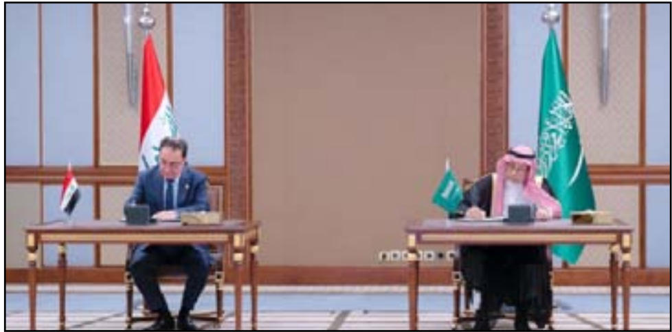
جانبا من مراسم توقيع اتفاقية الربط الخليجي أمس الأول

تعتبر له خدمة بعلاواتها وترفيعاتها مع الاحتفاظ بالدرجة الوظيفية بعد انتهاء الخدمة». ولفت، إلى أن «غير الموظفين ستكون لهم امتيازات فضلا عن الرواتب الشهرية التي حددها القانون، فستكون لهم الأولوية في التعيين لدى مؤسسات الدولة العراقية». وكانت قيادة العمليات المشتركة قد أكدت في وقت سابق بحسب بيان صدر عنها ان «قانون التجديد الإلزامي مهم جدا لإدامة زخم القوات الأمنية وزج دماء شابة جديدة في وزارة الداخلية والدفاع والأجهزة والوزارات الأمنية الأخرى». وأضاف البيان، أن «القانون سيرفع من قدرات القوات الأمنية ويكون دافعا للعمل بامتكانيات وقدرات عالية جدا وحافزا قويا لدحر الإرهاب». وأشار، إلى أن «القانون رفع الى مجلس النواب ويتضمن تسلسلا عمريا اضافة الى اختلاف الخدمة من ناحية الشهادة بالنسبة الى خريج الإعدادية او البكالوريوس او الماجستير او الدكتوراه»، موضحا ان «القيادة في انتظار موافقة مجلس النواب على هذا القرار، وجاهزون لتطبيقه». يذكر أن العراق ألغى نظام التجديد الإلزامي بعد تغيير النظام السابق في عام 2003، ويتجه حاليا إلى إعادته ولكن بضوابط جديدة اقل شدة عما كانت عليه في السابق.