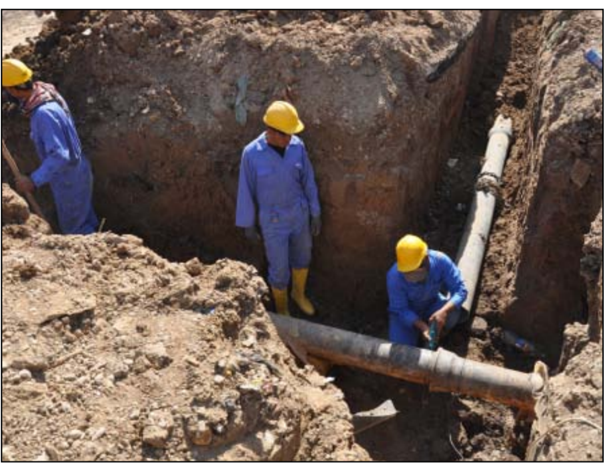
مد شبكات مياه جديدة في منطقة الزعفرانية في بغداد... عدا: محمود رؤوف