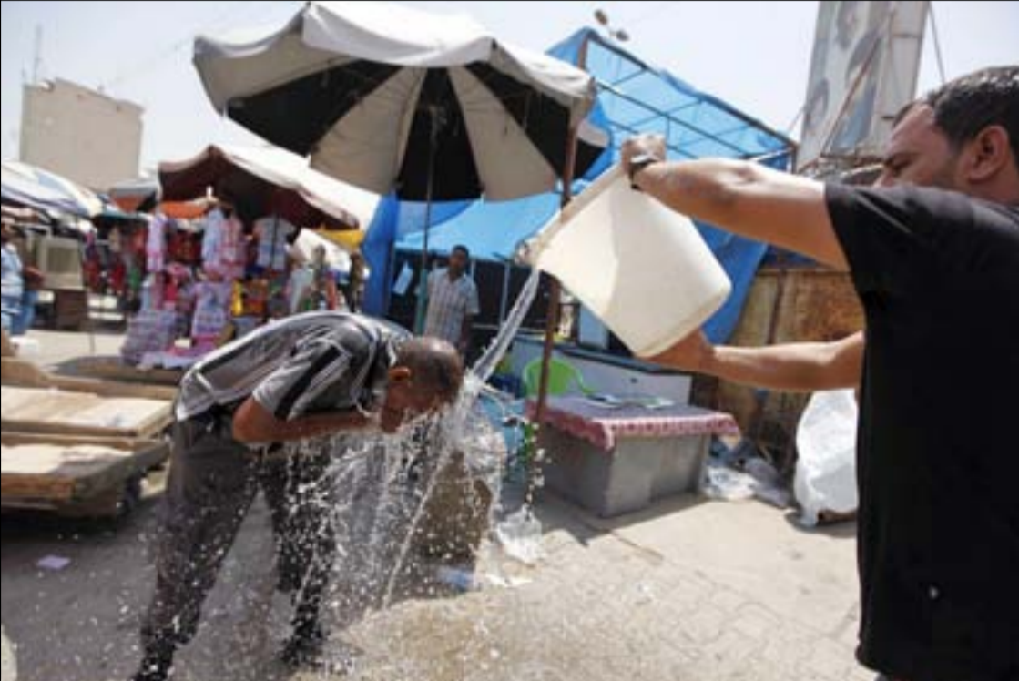
درجات الحرارة تبلغ ذروتها خلال الأيام المقبلة