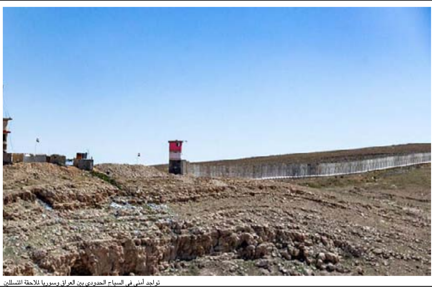
توجد أمثي في السباح الحدودي بين العراق وسوريا للاطلاع المتسللين

داعش يعيش في المخيم الذي يضم أكثر من ٦٥ ألف شخص". ونوه، إلى أن "المخيم أصبح يمثل تهديداً أمنياً للعراق وسوريا والمنطقة عموماً". وأوضح التقرير، أن "هناك أكثر من ٨ آلاف امرأة من زوجات وراجل داعش في منطقة الحسكة والتي يشكل النساء والأطفال الغالبية العظمى منهم وما لذلك من مخاطر على كل من العراق وسوريا والمنطقة عموماً".