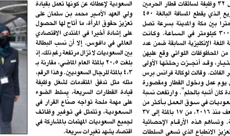
متابعة / المدى

لشغل ٣٢ وظيفة لسائقات قطار الحرمين السريع الذي يقطع المسافة البالغة ٤٥٠ كيلومتراً بين مكة والمدينة بسرعة تصل إلى ٣٠٠ كيلومتر في الساعة. وكانت معلمة اللغة الإنكليزية السابقة ضمن عدد قليل من المحظوظات اللواتي وقع عليهن الاختيار، وقد أنجزت رحلتها الأولى الشهر الفائت. وقالت لوكالة فرانس برس "أول يوم عمل وبخول القطار ومقصورة القيادة كان أشبه بالحلم". وارتفعت نسبة السعوديات في سوق العمل بأكثر من الضعف منذ ٢٠١٦، من ١٧ بالمائة إلى ٣٧ بالمائة. وتساهم هذه الأرقام الإحصائية في مدينتها الساحلية جدة، إلا أنها انضمت العام الماضي إلى ٢٨ ألف امرأة تقدمن