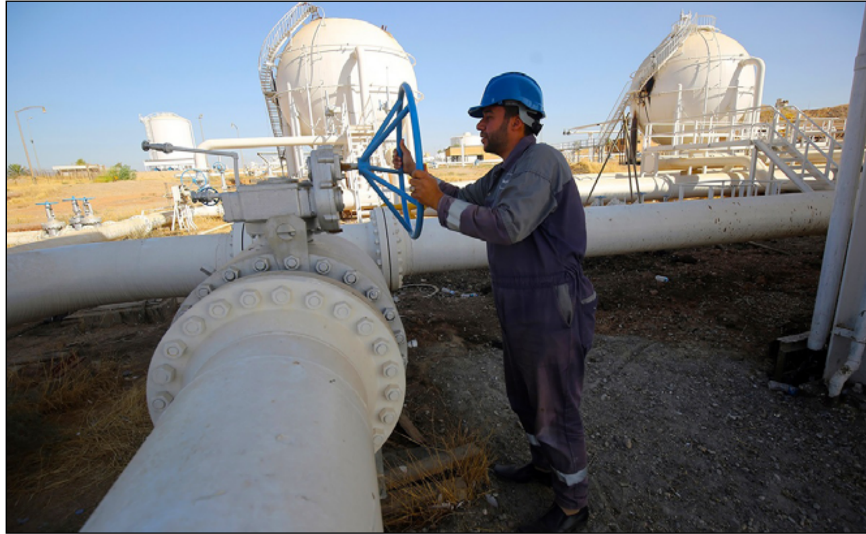
مشروع مد أنبوب نفطي إلى ميناء العقبة أصبح قريباً من التنفيذ