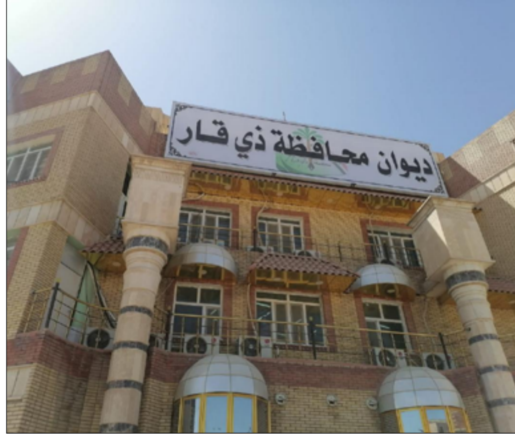
مبنى الإدارة المحلية في محافظة ذي قار

ويشكل نقص الخدمات في المناطق الشعبية تحدياً كبيراً للحكومة المحلية التي غالباً ما تعزو ذلك النقص إلى عدم تناسب التخصيصات المالية المرصودة من الحكومة الاتحادية مع حجم الحاجة للمشاريع الخدمية، فيما تدخل الاعتراضات العشوائية في بعض الأحياء كأحد العوامل المعرّقة لتنفيذ المشاريع.