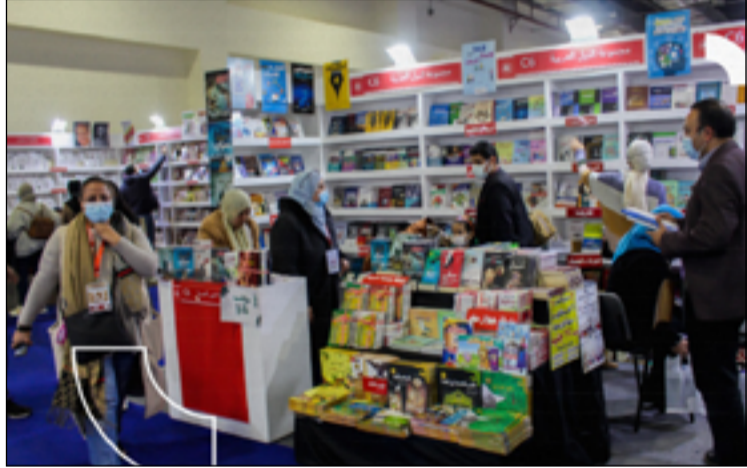
متابعة / المدى

يشهد معرض القاهرة الدولي للكتاب نوعاً تفاعلياً من الروايات لم يكن مألوفاً في عالم النشر، فهي روايات تسمح للقارئ بالمشاركة في صياغة وإكمال أحداثها من خلال بعض الصفحات الفارغة بها. تهدف هذه الفكرة النوعية إلى إعطاء القارئ فرصة ليكون جزءاً من أحداث الرواية واختبار قدرته على التأليف واستكشاف روايتين مبدعين جدد. وتتواصل فعاليات المعرض في نسخته الرابعة والخمسين بمشاركة أكثر من ألف ناشر من ثلاث وخمسين دولة.