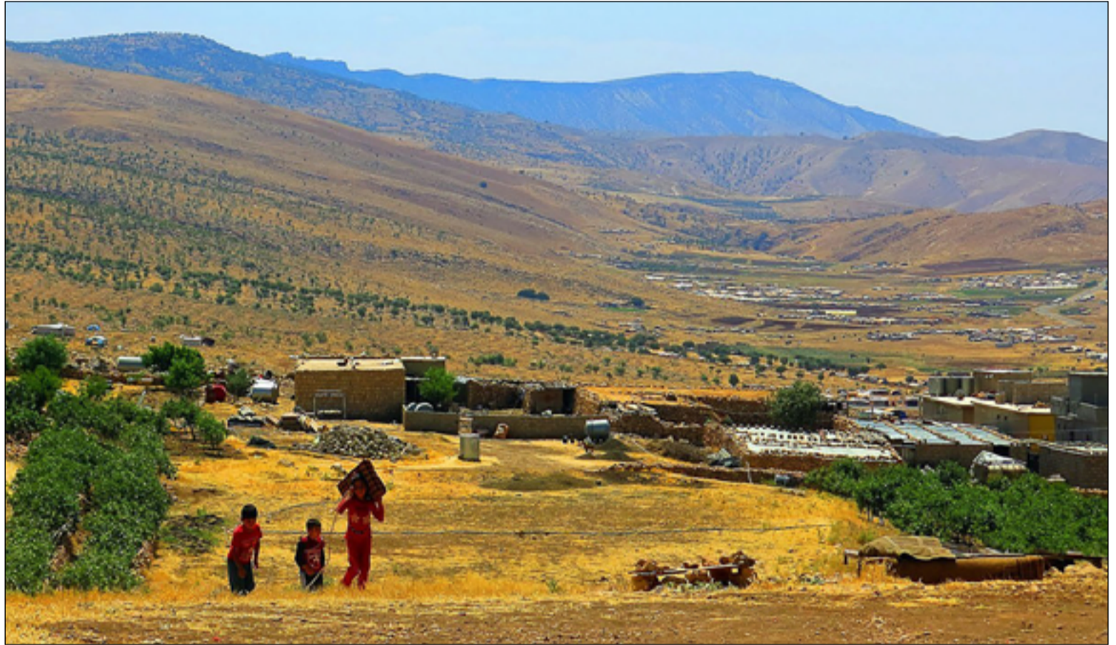
من الأراضي الزراعية في قضاء سنجار

ويسترسل، أن "الحل الوحيد لتلافي أزمة المياه هي حفر آبار