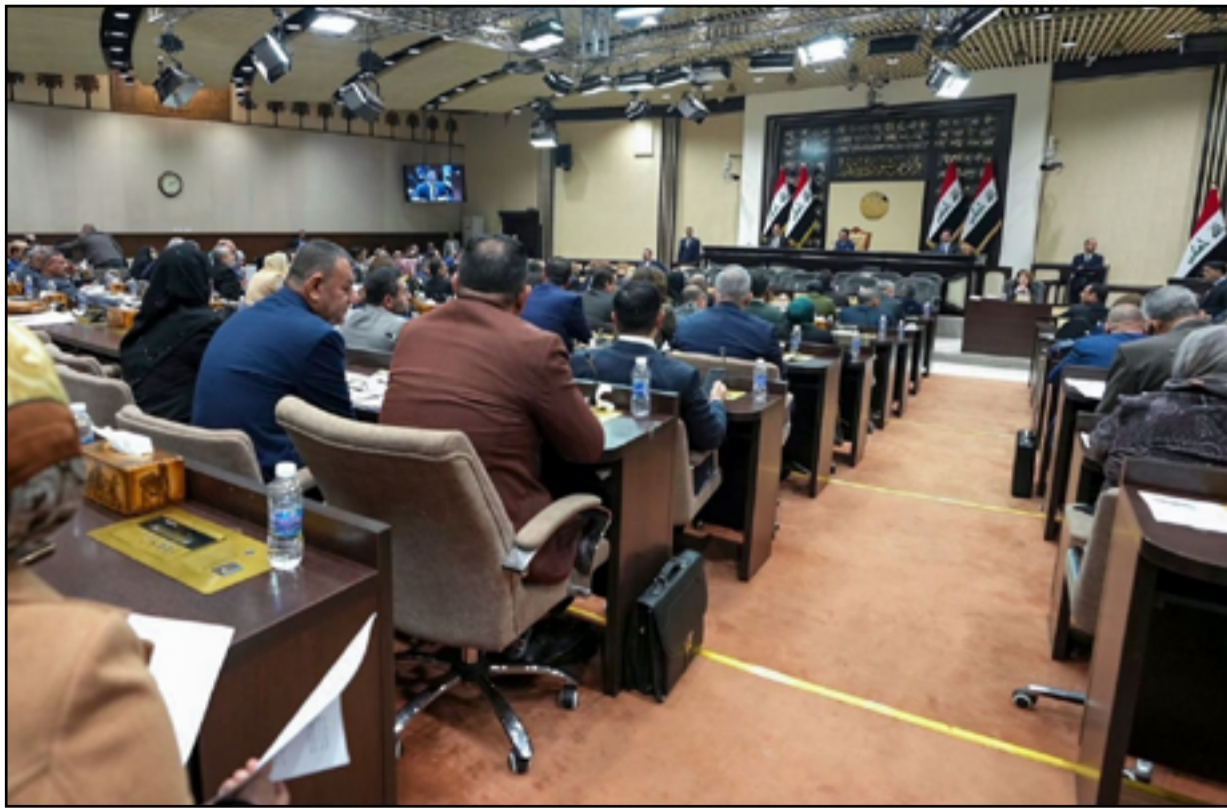
جلسة البرلمان ليوم أمس الأول