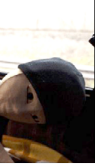
بغداد / عامر مؤيد