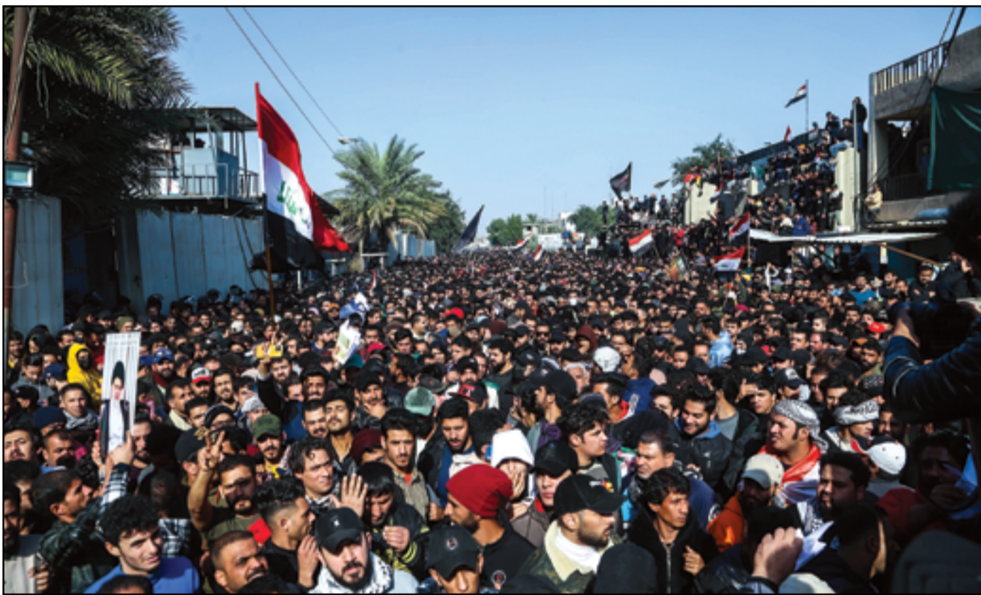
تظاهرة حاشدة للمحاضرين والمجانين والإداريين في تربية الرصافة الثالثة...