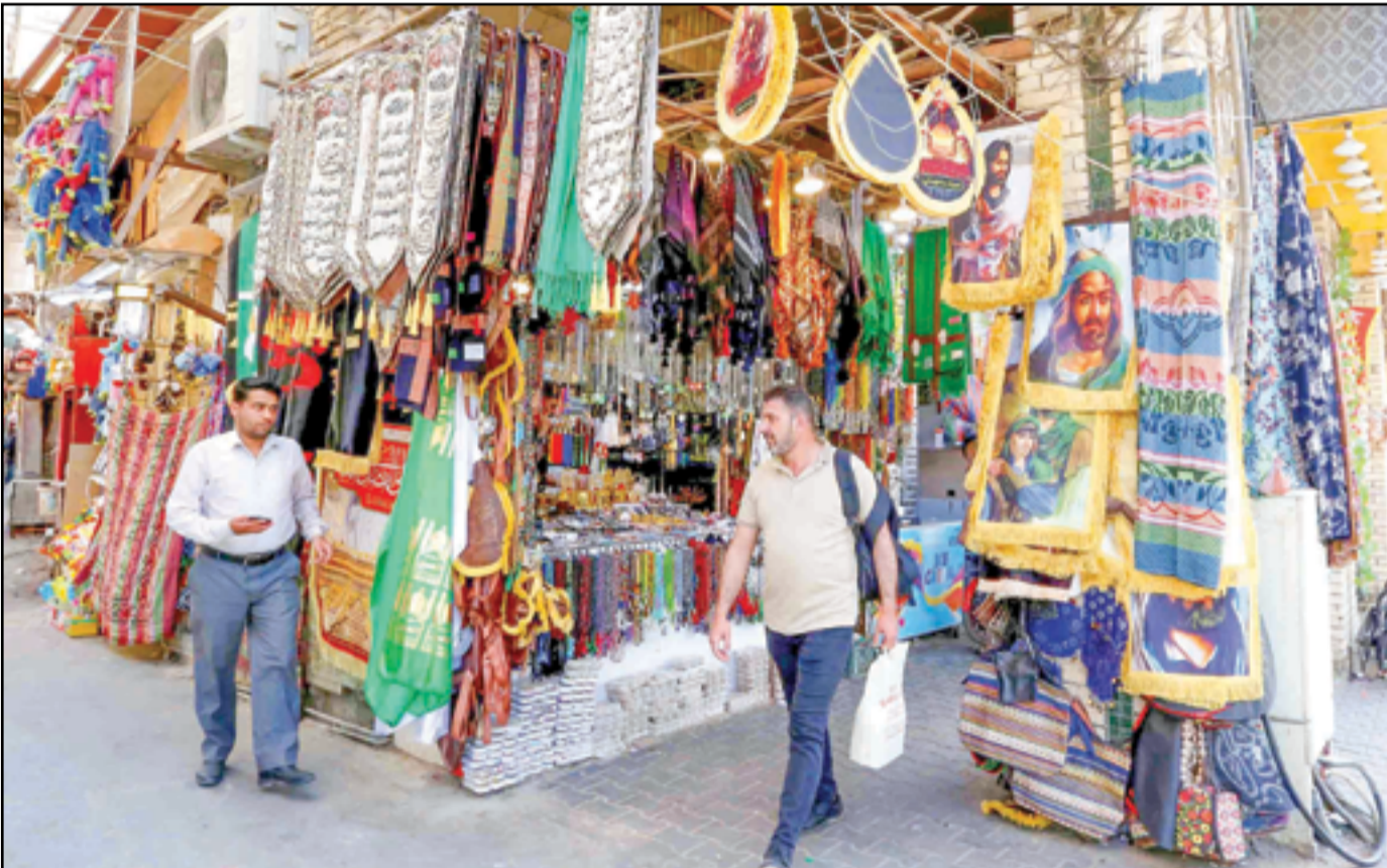
الأسواق الشعبية في كربلاء تستعد للعيد.. عدسة: محمود رؤوف

أكدت اللجنة الامنية بمجلس محافظة البصرة، يوم السبت، أن الحرب مع تجار المخدرات لا توجد فيها خطوط حمراء وهي معركة إثبات وجود، مشيرة الى أنها لا تملك معلومات وافية عن بيع المخدرات داخل أروقة الجامعات. وقال رئيس اللجنة، عقيل الفريجي في حديث صحفي تابعته (المدى)، أن تكرار إصابات المنتسبين أثناء الاشتباك مع تجار المخدرات دليل على إصرار واقدام القوات الامنية على مواجهة تجار المخدرات لأن الحرب