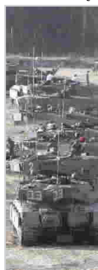
الآلية الحربية الاسرائيلية تتوغل في الاراضي اللبنانية

ان عمق مقاومة حزب الله قد ادى باقادة الاسرائيليين إلى التراجع عن تعريفهم للنجاح، من سحق حزب الله بقوة مقاتلة إلى مجموعة اخرى من الاهداف. فقد اخبر وزير الامن الداخلي في دشر التايام بان اسرائيل تبحث الان عن اطلاق سراح الجنديين الاسرائيليين