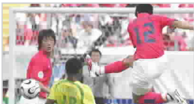
لقطة من إحدى مباريات كوريا الجنوبية في المونديال الأخير

الموهبة .. لكنهم يفترقون إلى التفكير الاستراتيجي ..... وأضاف .....عندما اخترت ٣٦ لاعبا في ٢٩ تموز طلبت منهم أن يفكروا قبل أن يلعبوا الكرة. ولا يمكننا الفوز حالياً بالاعتماد فقط على حماسة الشباب ..... وأشار فيريبيك إلى أن اللاعبين الصغار في الفريق لم يستطيعوا اثبات قدراتهم على أرض الملعب وربما