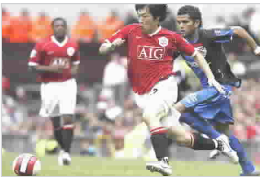
موسم شاق يواجهه ضيوف الدوري الألماني