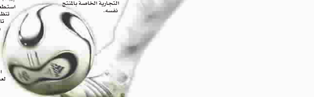
ميسي يتوجس المشاركة مع برشلونه

واكد الخليفي ان جميع المنتجات الرسمية للالعاب تلبى اعلى متطلبات ومعايير الجودة والسلامة كما يتضح من خلال العلامة الخاصة بكل منتج علي حدة او كما يظهر علي اغلفة تلك المنتجات او العلامة التجارية الخاصة بالمنتج نفسه.