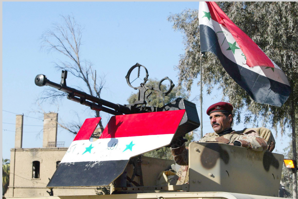
دورية للجيش العراقي