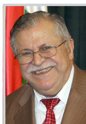
جلال طالباني ممثل / الصدا / الوكالات استقبل رئيس الجمهورية جلال طالباني مساء أمس الأول في عمان سفراء الدول العربية لدى الأردن بحضور برهم أحمد صالح نائب رئيس الوزراء وملا بختيار عضو الهيئة العاملة في المكتب السياسي

بغداد خطوة إيجابية لاستقرار العراق والمنطقة، معتبرا لقاء ممثلي إيران والولايات المتحدة بالنقطة الايجابية. وأضاف الرئيس طالباني: ان تحسين العلاقات الايرانية الأمريكية يصب في مصلحة المنطقة برمتها، معرباً عن أمله بأن تؤدي هذه الاجتماعات الى ترسيخ الأمن والاستقرار في العراق والمنطقة ككل مؤكداً ان جميع الخلافات والنزاعات يمكن حلها عن طريق الحوار والتفاوض. كما شدد على ضرورة تعزيز العلاقات بين العراق والدول الجارة ولا سيما الدول العربية. من جهة اخرى التقى الرئيس طالباني الدكتور عادل عبدالمهدي نائب