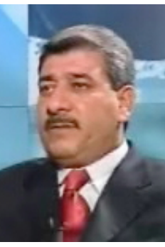
بغداد / نصير العوام وصل الى دمشق امس الأول نائب رئيس الوزراء الدكتور سلام الزوبعي في زيارة رسمية تستغرق عدة ايام وكان في استقباله بالطيار نائب رئيس الوزراء لشؤون الاقتصادية عبد الله السدردي وعسد من المسؤوليين. وعقد الزوبعي فور وصوله

بغداد / نصير العوام وصل الى دمشق امس الأول نائب رئيس الوزراء الدكتور سلام الزوبعي في زيارة رسمية تستغرق عدة ايام وكان في استقباله بالطيار نائب رئيس الوزراء لشؤون الاقتصادية عبد الله السدردي وعسد من المسؤوليين. وعقد الزوبعي فور وصوله اجتماعا مع رئيس الوزراء السوري ناجي العطرى وبحثا مجمل قضايا التعاون الامني والخدمي بين البلدين وسبل تعزيز دعم الحكومة والشعب السوريين للشعب العراقي والوقوف معه لتجاوز ظروفه الصعبة اضافة الى وضع الأطر لإتفاقيات مستقبلية تسهم في حل مشكلات الإقامة والعمل التي تواجه الجالية العراقية هناك. كما التقى نائب رئيس الوزراء وزير الصحة والزراعة السوريين وبحث معهم سبل تبادل الخبرات في مجالات الصحة والادوية والمستلزمات الطبية اضافة الى استخدام الاساليب والمكننة الحديثة في الزراعة.