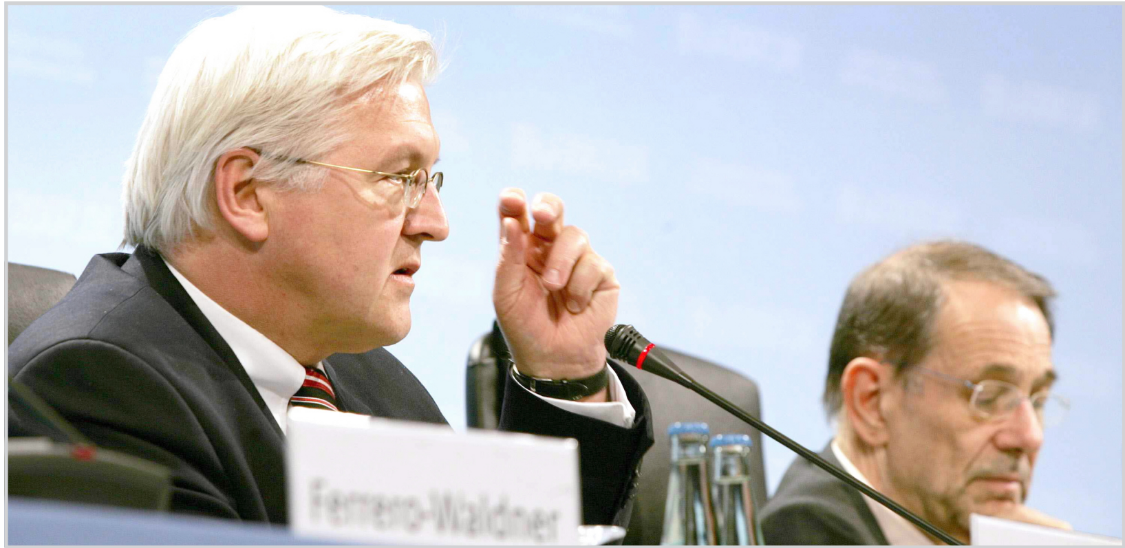
في جلسة لوزراء خارجية دول الاتحاد الأوروبي

قضية الإيثانول اثارت انفعالات فرنولية وكوبية عنيفة ودعا كاسترو في مقال له امريكا والدول الأوروبية الى عدم الترويج لفكرة الطاقة البديلة والعمل بجد على اطعام جيع العالم. الا ان التوجه العالمي نحو الطاقة البديلة وهو التوجه الذي تتزعمه الولايات المتحدة بقوة من المتوقع ان يقدم على خطوات اكثر اثرة للحد من الخلاف وقد بات من المؤكد ان امريكا تنظر بعين كبيرة وشبهة الى القوات العالمي وتفكر في شيء ما.