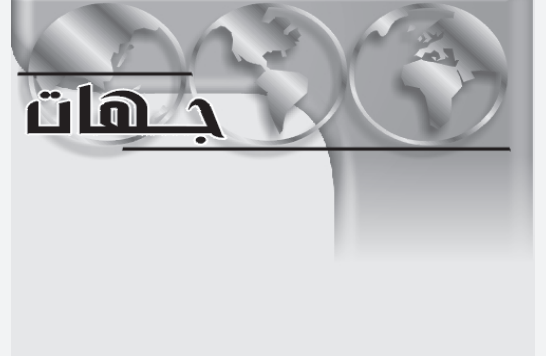
المدى / وكالات